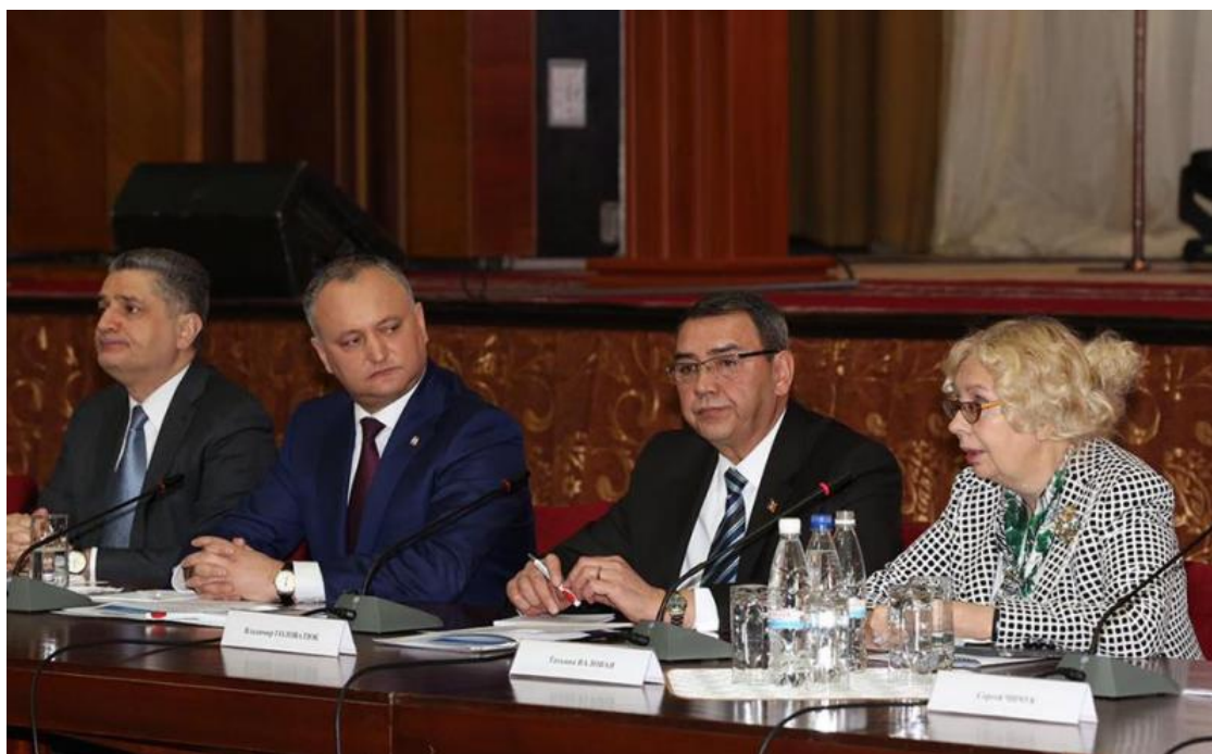
La Forumul Internațional a fost semnat „Memorandumul de colaborare între Comisia Economică Eurasiatică și Republica Moldova.“